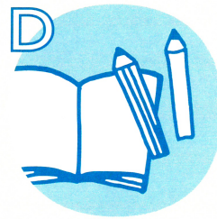
D 教材 2,000円相当