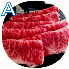
A 佐賀県産のお肉 200g