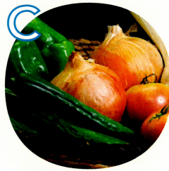
C 佐賀県産のお野菜 旬のもの2,000円相当